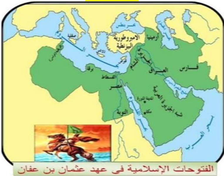
انظر الشكل رقم 6