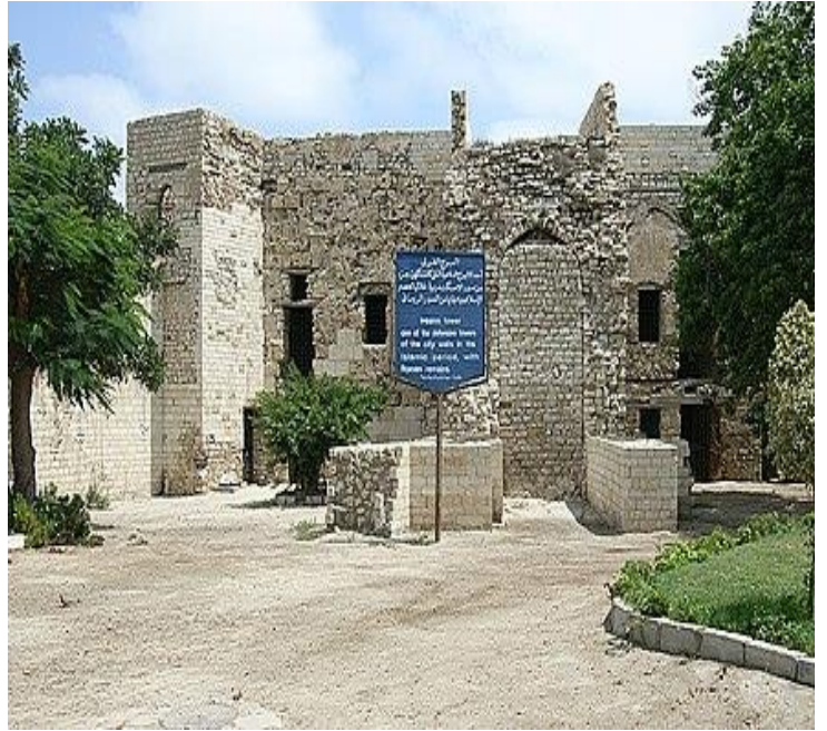
انظر الشكل رقم 5