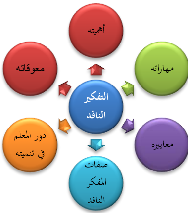
شكل(1) مخطط للبعد التربوي.

يجب التنويه إلى استخدام التفكير الناقد ضمن عملية التدريس، وتحديدًا في المواد التاريخية؛ حتى يسهل على الطالب تحليل الأحداث التاريخية، وتقييمها من وجهة نظرهم؛ لذلك وجب الإشارة أولاً إلى مفهوم التفكير الناقد كما ذكرنا، ومن ثم يمكننا الآن تحديد نقاط أخرى سنتحدث فيها عن التفكير الناقد كما بالشكل التوضيحي التالي: