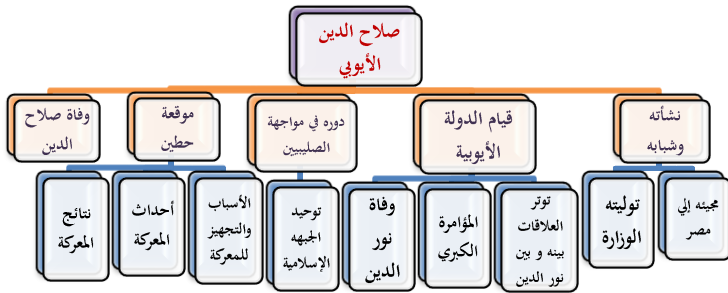
شكل (2) خريطة معرفية لعناصر البعد التاريخي.

بعد التعرف على أصل الصليبيين وأسباب مجيئهم، نتقل الآن إلى الحديث عن شخصية مؤثرة في التاريخ، وقد لعبت دوراً فعالاً في مواجهة الصليبيين و تحرير بيت المقدس من أيديهم، لما له من شخصية عسكرية مميزة وقائد قوي يمتلك مهارات التخطيط الإستراتيجي وهو صلاح الدين الأيوبي الذي سنتناول الحديث عنه في شكل النقاط التالية: