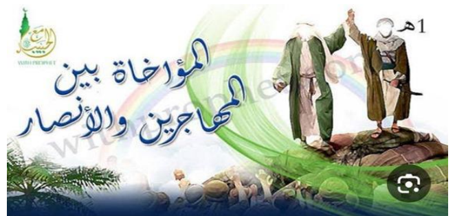
شكل (6): يوضح المواخاة بين المهاجرين والأنصار