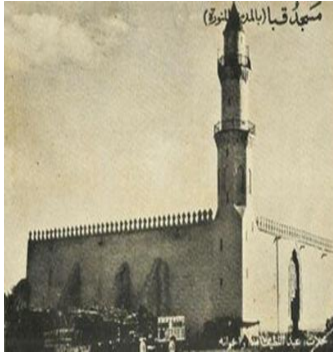
شكل (3): يوضح مسجد قباء