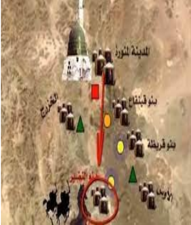
شكل (2): يوضح القبائل في المدينة المنورة

*وأخيراً التأكيد على القيم الإنسانية التي غرسها الرسول (ص) في مجتمع المدينة المنورة ومنها: الإيثار والتضحية والمحبة والمساواة والعدل وغيرها من القيم التي لا بد من الالتزام بتطبيقها في الوقت الحالي من أجل صلاح المجتمع على جميع المستويات.